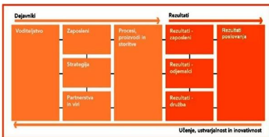
Slika 2 Model odličnosti po modelu EFQM

Vir: 1 https://www.podjetniski-portal.si/poslovna-odlicnost/model-poslovne-odlicnosti-efqm (17. 12. 2020)